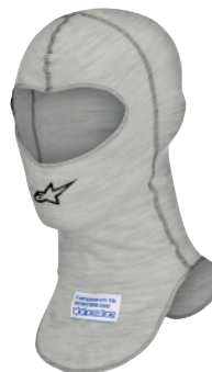
Alpinestars oferuje dwie linie bielizny w postaci podstawowej serii Race oraz wyższej ZX.