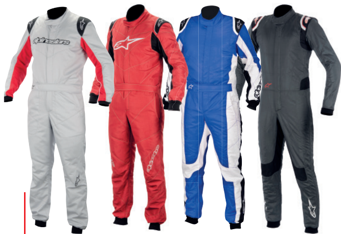
Alpinestars ma w ofercie cztery modele w postaci: GP Start, GP Race, GP Tech oraz topowego Supertech.

Do tej pory w świecie motosportu marka Alpinestars była głównie kojarzona z torami kartingowymi. Produkty tej firmy były wybierane szczególnie przez młodych zawodników ze względu na bardzo nowoczesny i „bajerancki” design. Warto wspomnieć, iż Alpinestars był pierwszą marką, która wprowadziła na rynek produkty w kolorach fluo, bez których trudno obecnie wyobrazić sobie ofertę jakiegokolwiek producenta odzieży rajdowej czy też wyścigowej. Od tego sezonu firma Alpinestars rozpoczyna inwazję na rynek akcesoriów z homologacją FIA. Wraz z bardzo efektownym designem zacierpnie- tym z kolekcji kartingowych idzie także bardzo wysoka jakość wykończenia. W naszym przekonaniu na rynku rośnie kolejno, duży gracz.