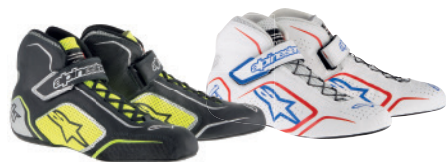
Oferta butów została podzielona na kilka modeli, tak by każdy mógł znaleźć coś co odpowiada jego potrzebom oraz mieści się budżecie sponsora.