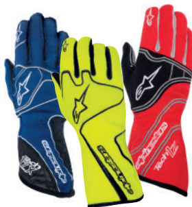
Rękawice tradycyjnie zostały podzielone na modele podstawowe (Tech 1 Start), wyższe (Tech 1 Race oraz Tech 1-Z) oraz topowe (Tech 1-ZX).